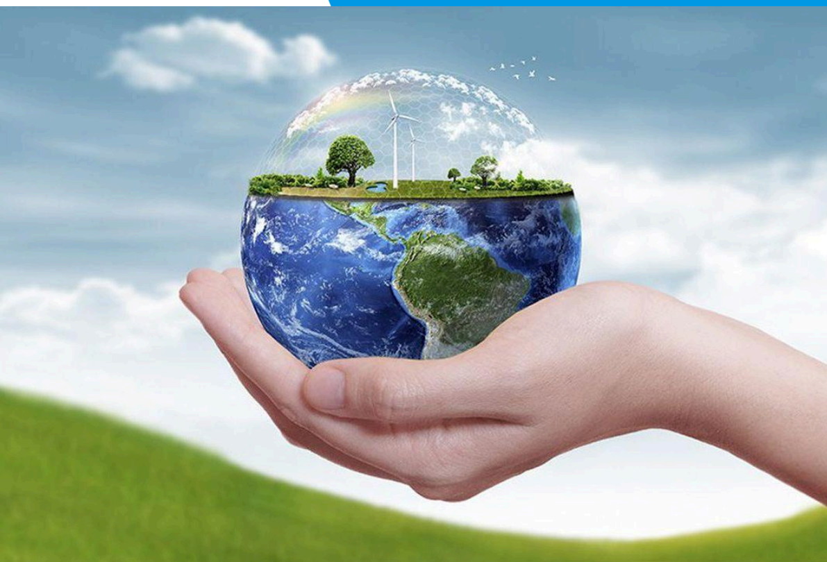
image illustrant le zéro déchet dans le monde.